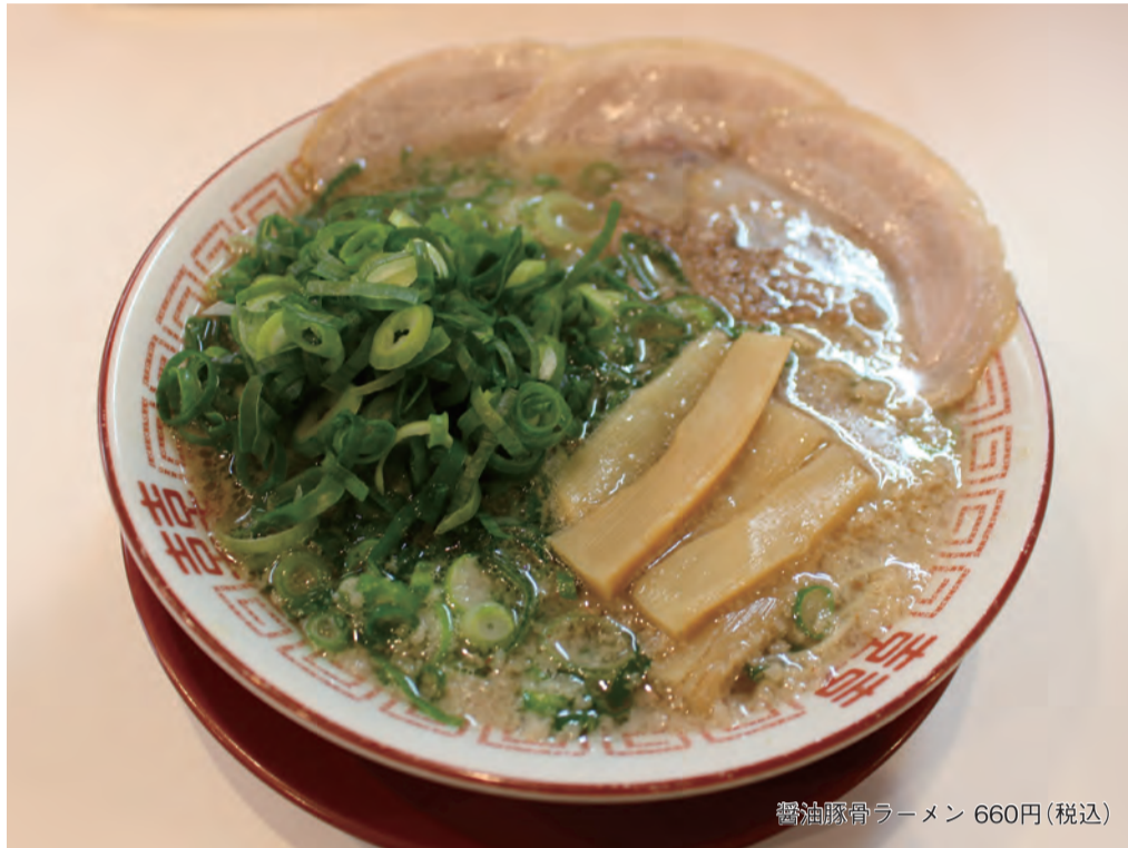
醤油豚骨ラーメン 660円(税込)