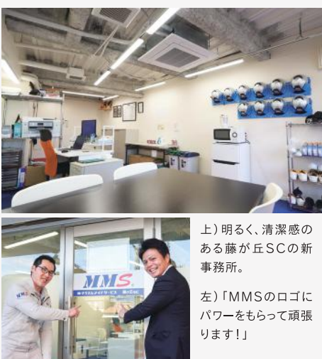
上) 明るく、清潔感のある藤が丘SCの新事務所。 左) 「MMSのロゴにパワーをもらって頑張ります!」