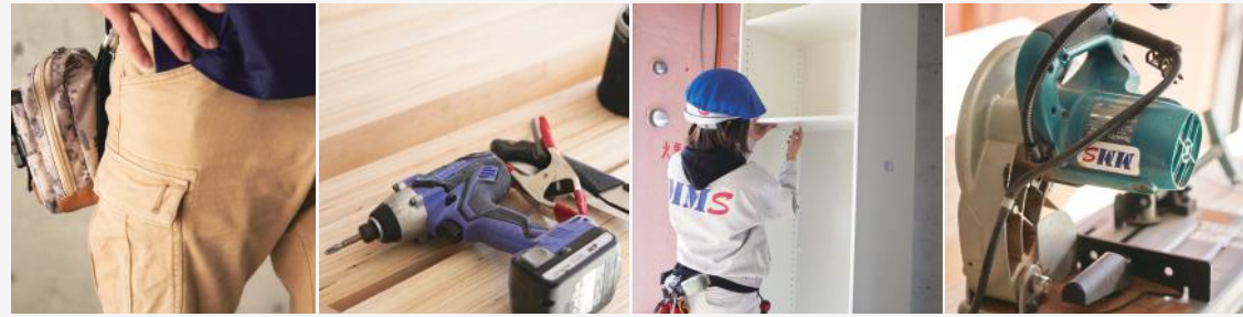
入居者様が直接ご使用になる家具は、施工の精度もシビア。丁寧な作業が必要です。