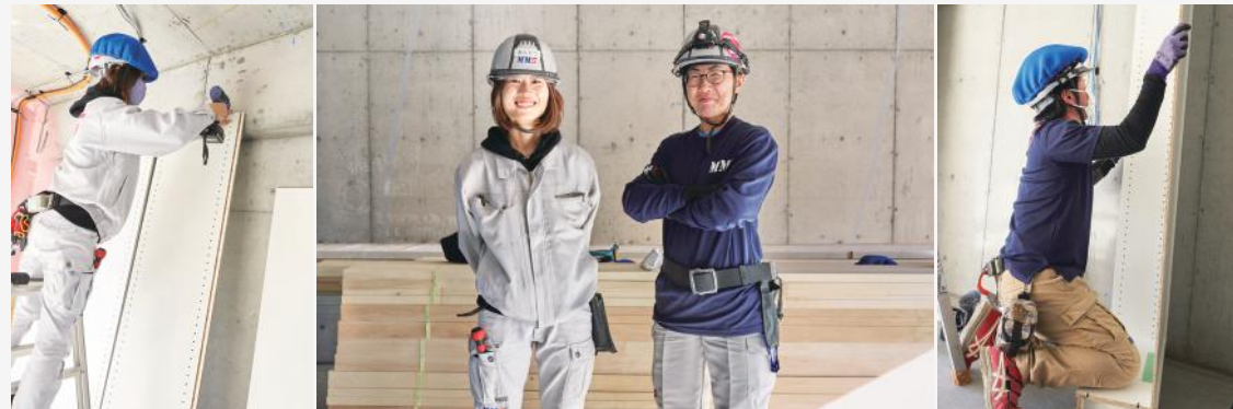
MMSなら家具資材を搬入後そのまま組立て作業ができるため、時間のロスがなく現場の進行もスムーズ。

建設現場は常に職人や現場監督者の人手が足りないうえ、最近では働き方改革などもあって、多くのお客様が頭を悩ませておられます。通常MMSが請け負っているのは、資材搬入・揚重のほか施工補助やコンクリート工事などの軽作業ですが、お客様のお困りごとを解決するべく、最近では従来の担当業務を超えて幅広く対応。MMSが26年間モットーとして続けている“最強のお手伝い”のポリシーで、工期がスムーズに進行するよう尽力しています。ここ東海エリアでは、約5年前から現場での家具組立て作業を代行し、お客様の業務軽減に貢献しています。