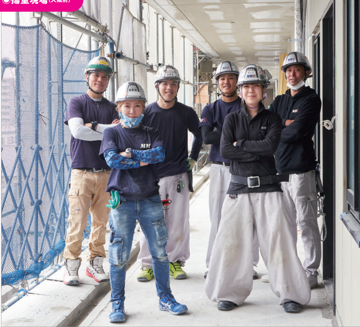
作業中は張り詰めた空気に包まれているが、ひと段落すると一転、和やかなムードに。MMSのチームワークのよさは、男性も女性も変わらない。