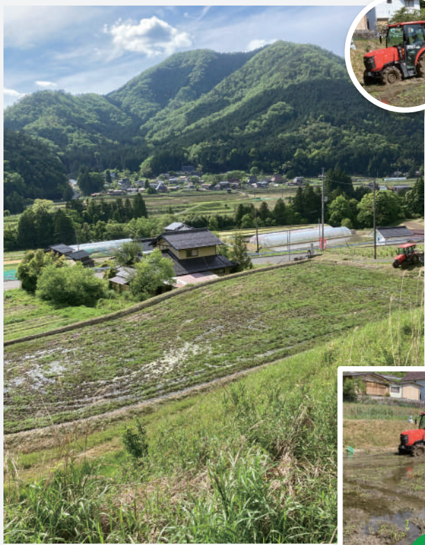
京都府の京丹波町に広がるマグナムファーム。