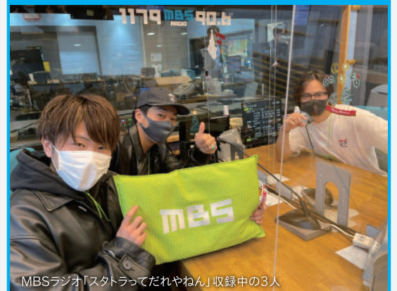
MBSラジオ「スタートラってだれやねん」収録中の3人

天王寺SC所属の3人組ボーカルグループ「Star T Rat(スタートラット)」。MMSで働きながら、精力的に音楽活動を繰り広げる彼ら。MBSラジオで冠番組「スタートラってだれやねん」(2022年2月~放送中)を担当するなど、ますます活躍の幅を広げています。みんなで応援しましょう!